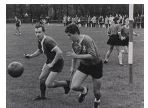
1968 wedstrijd HKV – Ons Eibernest

Een bekende vereniging die in 1992 is ontstaan uit een fusie tussen de korfbalverenigingen HKV Voorwaarts (opgericht in 1919) en Ons Eibernest (opgericht 1920). Beide Haagse verenigingen hebben een lange, rijke historie binnen de korbalsport en genieten landelijke naamsbekendheid. Decennia lang hebben beide korfbalverenigingen de korbaltroon aangevoerd in Nederland. Den Haag is korfbalstad bij uitstek. De naam Ons Eibernest mag zelfs één van de bekendste sportnamen van Nederland genoemd worden en is onomstotelijk verbonden met de gemeente Den Haag.